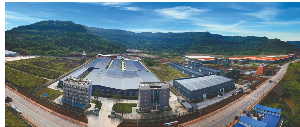
近年来,巴中市产业园区连点成片,发展迅速。图为城郊一处产业园的一角。