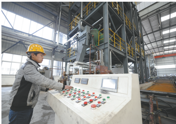
碳石墨生产车间里,工人正在操作设备进行生产。