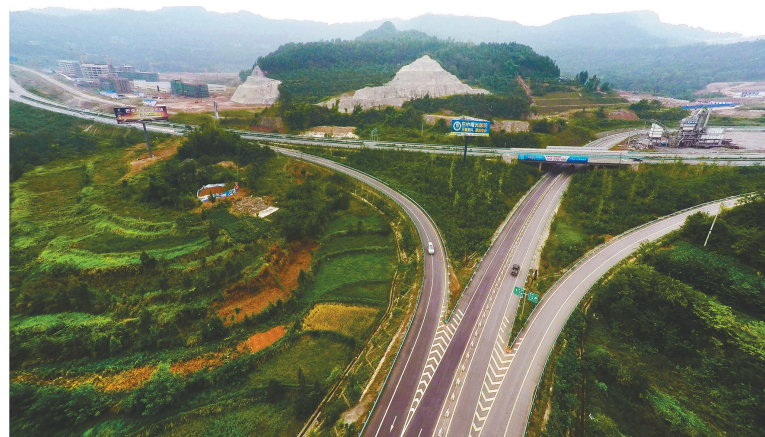
巴达高速兴文互通立交。