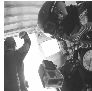
打开舱门依次起跳。

即使如此,目前中国范围内,除开编制内专业跳伞运动员,有证的玩家依然不足300人。“我们预测,3年后将会迎来第二波爆发,这个数字届时应该会超过千人。”