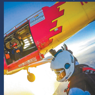
跳出飞机开始下坠瞬间。