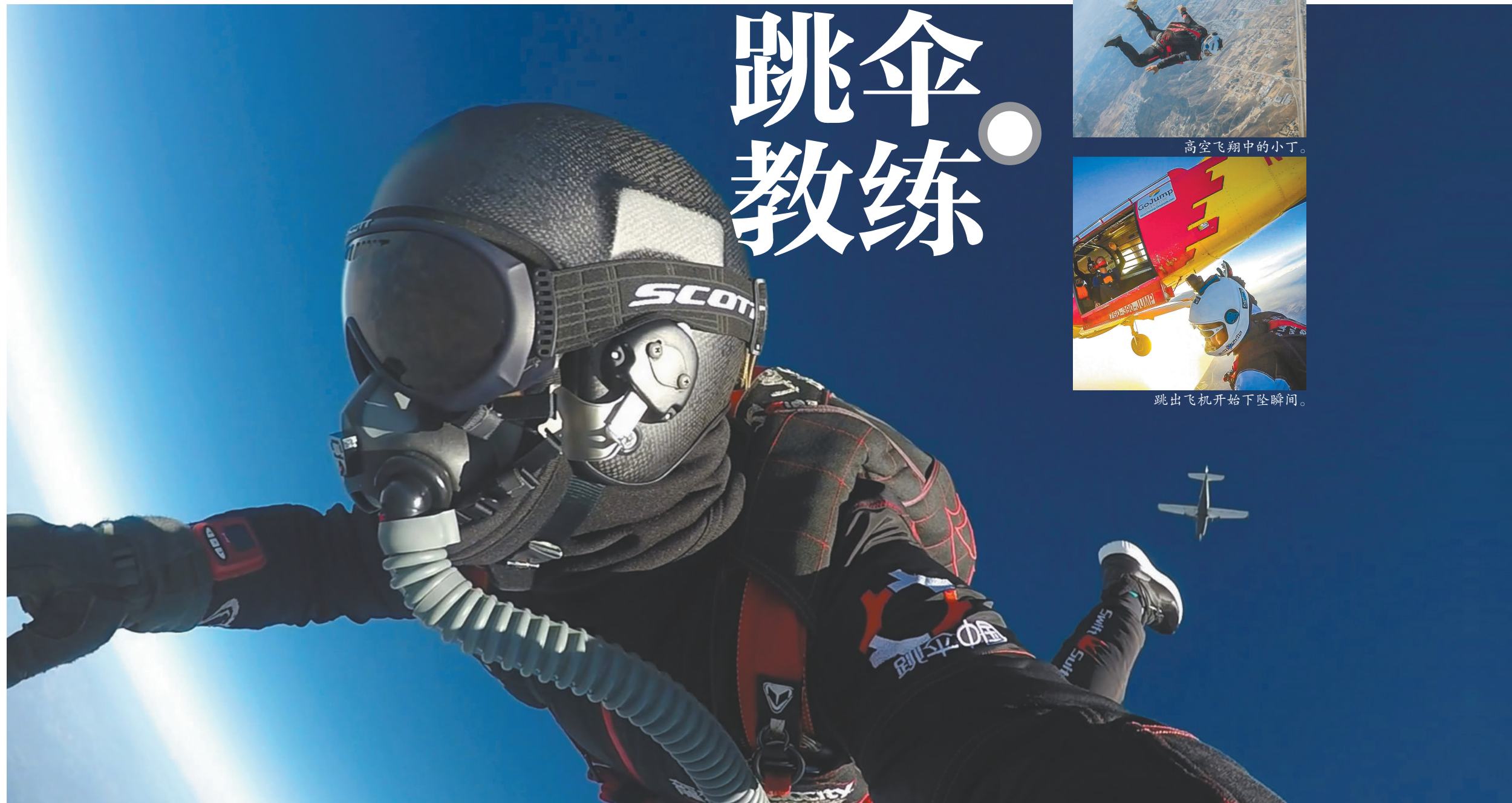
炫目的蓝天,远处的飞机,就是一幅飞翔的画卷。