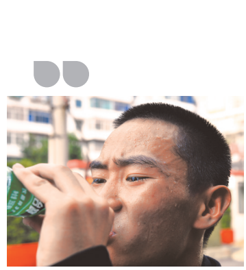
烈日下完成任务后的成都消防战士汗如雨下。

8月3日，中国气象局新闻发言人张祖强在新闻发布会上说，刚刚过去的7月，是我国自1961年以来的“最热7月”。