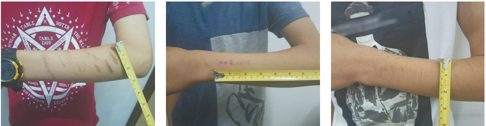
几位参与“蓝鲸”游戏的少年，手臂都有不同程度的划伤痕迹，这是游戏要求的一个“任务”。

移动互联网本来是方便人与人联系的好东西，却也对社交产生了新的负面影响。很多心理医生都遭到过类似的病例：患者现实中不懂得如何与人交往，在公共场合进退失据，但是在网游中的角色扮演却如鱼得水，吸引了一大帮朋友。