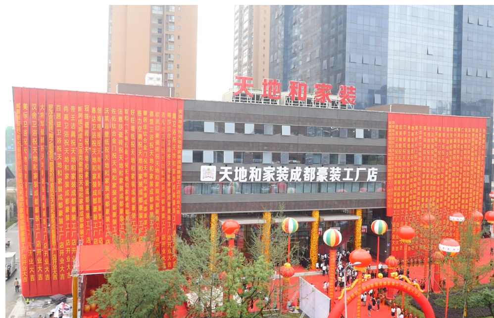
天地和推出“真全包样板房征集”,打击假全包