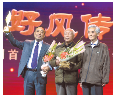
成都市金堂县贺氏家族代表。

锄与经并举,贺氏历代致力于兴办教学。在落地地成都金堂五凤,贺氏家族先后兴办了凤仪书院、安风义