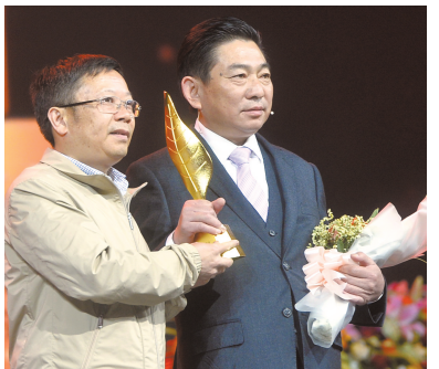
内江市威远县崔氏家族代表。

诉记者:“真没有想到能被评为十佳‘天府好家规’。我觉得我们家族就两点:有困难的,族人相互帮助,不给社会添麻烦;有能力的,努力为社会多做贡献。”