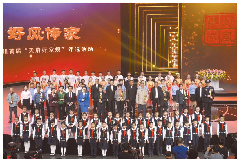
4月28日,四川首届“天府好家规”评选揭晓,十佳好家规代表集体合影。