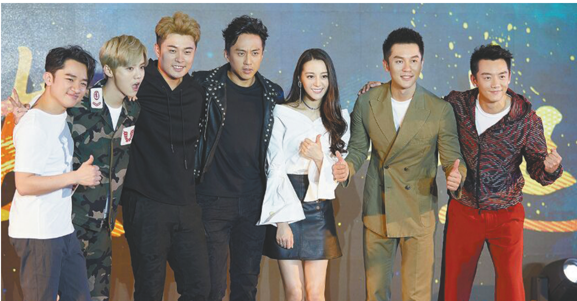
迪丽热巴(右三)加盟兄弟团,《奔跑吧》本周五回归黄金档。

4月10日晚,浙江卫视《奔跑吧》发布会在延安举行,邓超、李晨、陈赫、郑恺、王祖蓝、鹿晗、迪丽热巴共同出席。新加盟的热巴俨然“团宠”,被兄弟团照顾有加。而初为人父的陈赫发福不少,有媒体问及为节目做了哪些准备,鹿晗抢答说:“长胖。”