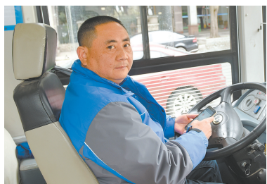
曾师傅的办法减少了“久等无车”的投诉。