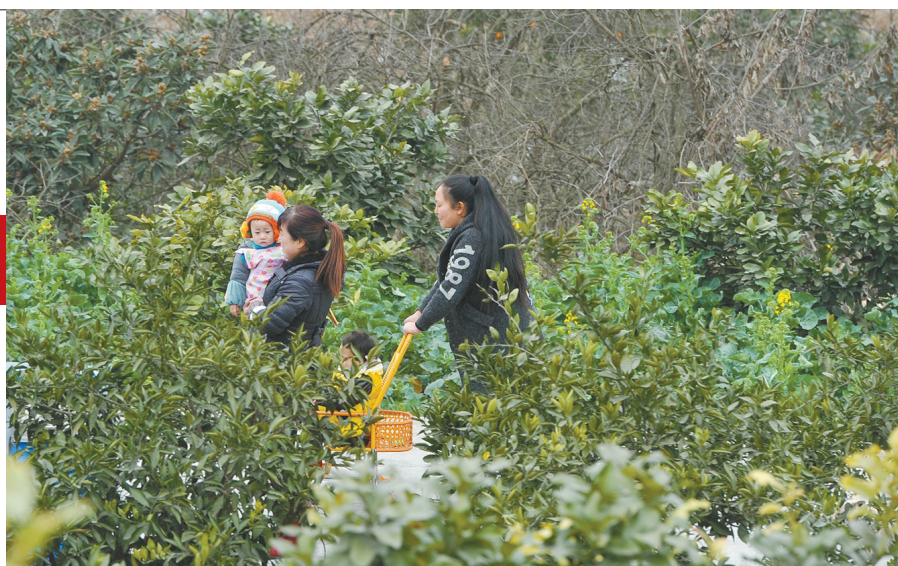
2月5日，村民在那家镇星光村茂密的果园里散步。

有柚花：“等到五一前后柚子花开的时候，那是别样的美。” 有诗歌：这个村子，因每两年举办一届农民诗歌节而出名。 有爱情：自拍讲述柚田里爱情故事的电视连续剧《岭上花开》。